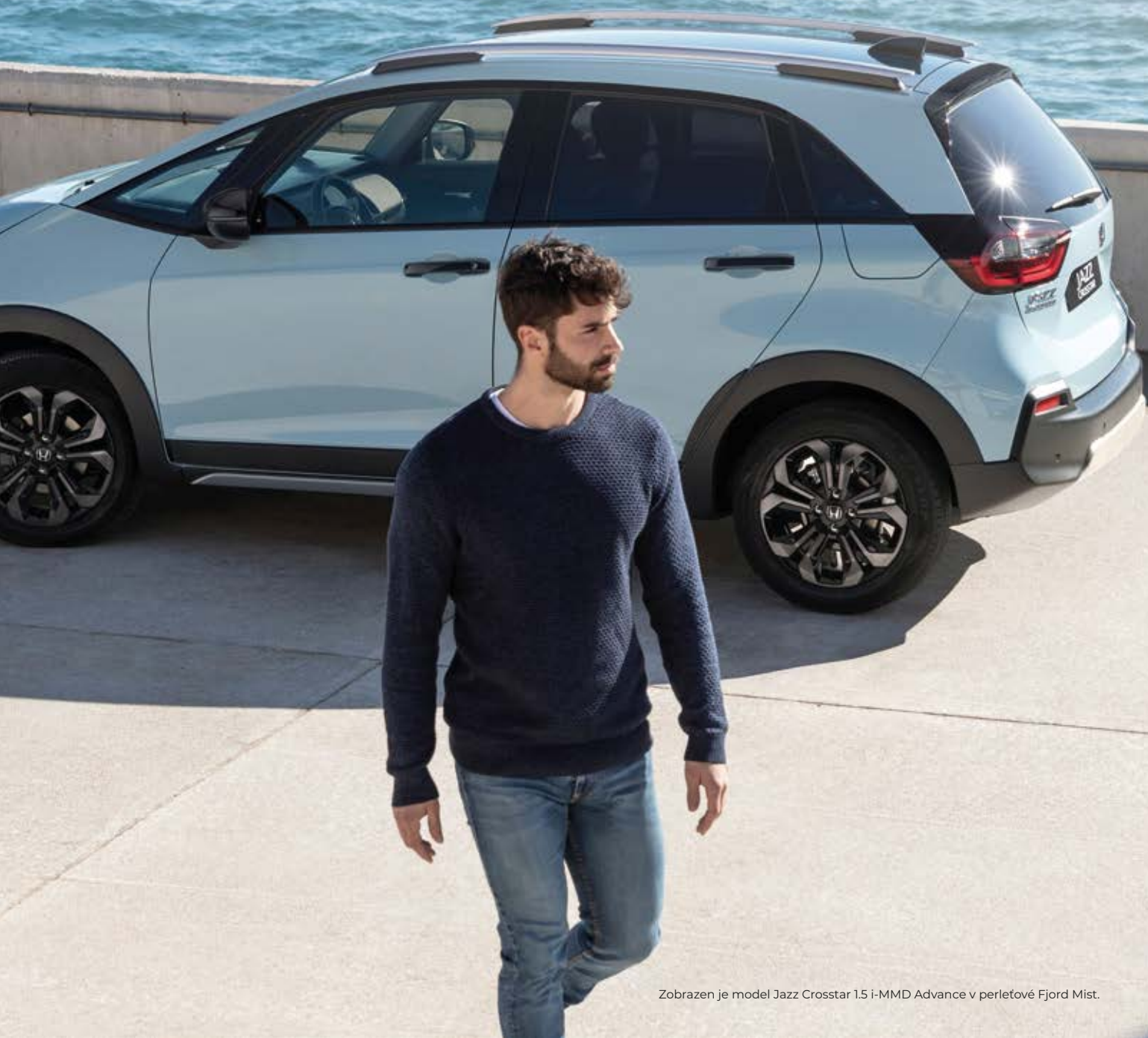
Zobrazen je model Jazz Crosstar 1.5 i-MMD Advance v perletové Fjord Mist.