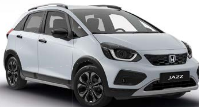
Perleťová Premium Sunlight White