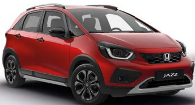
Metalická Premium Crystal Red

Vytvořili jsme širokou škálu barev, které dokonale ladí s novým stylovým modelem Jazz Crosstar. Barvy doplňuje čalounění prvotřídní kvality.