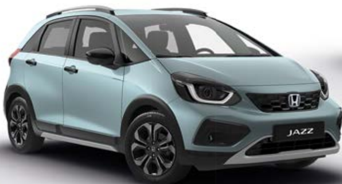
Perleťová Fjord Mist