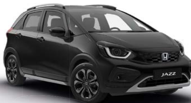
Perleťová Crystal Black